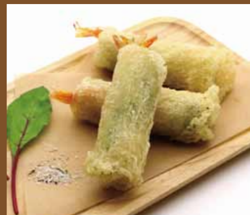
サンプルコピーサンプルコ 000+税 englishenglishe nglisenglishengli