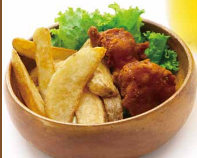
サンプルコピーサンプルコ 000+税 englishenglishe nglisenglishengli