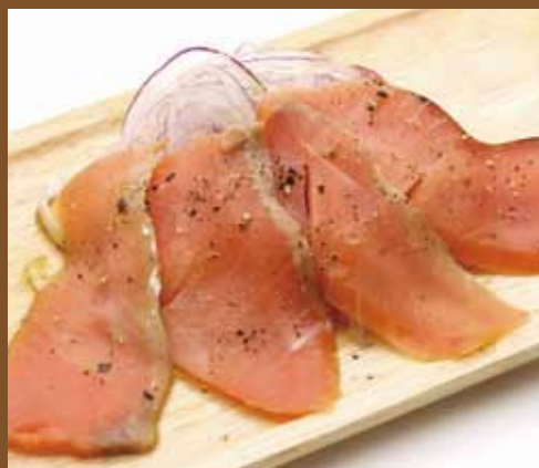
サンプルコピーサンプルコ 000+税 englishenglishe nglisenglishengli