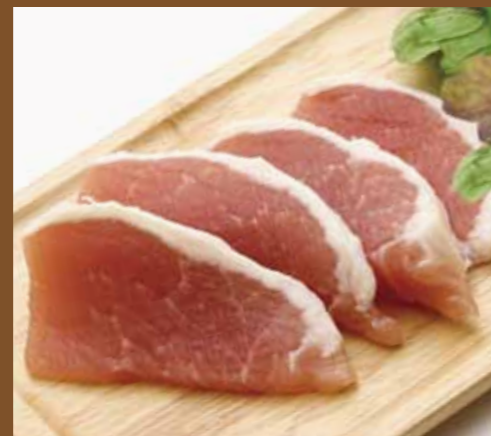
サンプルコピーサンプルコ 000+税 englishenglishe nglisenglishengli