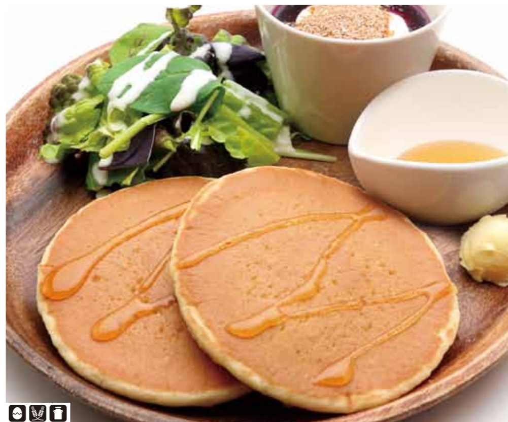
☎️🍴🍴 モーニングパンケーキプレート 570+税 Morning Pancake Plate アガベシロップで食べるパンケーキ。 サラダと、ロースト胚芽がのったブルーベリーソースのヨーグルト付きのプレートです。