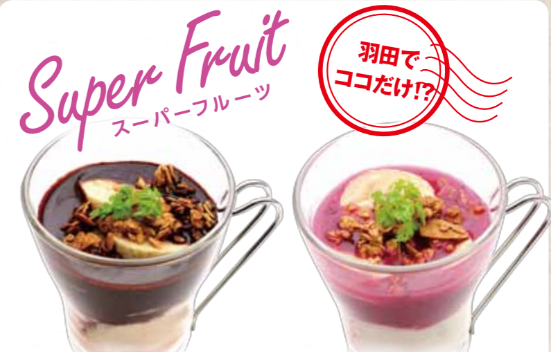
大麦グラノラ& アサイーヨーグルト Barley Granola & Acai yogurt 420+税 🍴 スーパーフルーツ“アサイー”に 大麦グラノラをプラス。