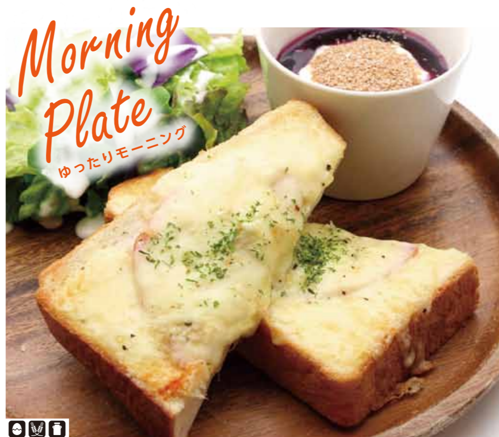
☎️🍴🍴 ハムとチーズのホットサンドプレート 570+税 Ham & Cheese Hot Sand Plate ハムとチーズとベシャメルソースを、ふっくら焼き上げたトーストにのせて焼き上げました。 サラダと、ロースト胚芽がのったブルーベリーソースのヨーグルト付きのプレートです